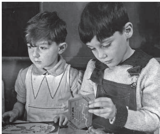
Мне 5 лет. Детский сад в Париже

— Что ж, попробую, — взял кораблик и стал возиться с веревкой. Я наблюдал за ним крайне внимательно, и почему-то сильное впечатление произвело на меня небольшое вздутие, которое я заметил на безымянном пальце его левой руки. Он легко справился с узлом, отчего я почувствовал себя неумехой, и отдал мне кораблик. Я поблагодарил его. А мама сказала: