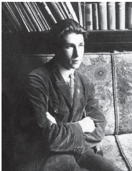
Папе 17 лет. Берлин, 1925 г.

России, и напротив — ограничение влияния церкви станет свидетельством роста демократии. Что и говорить, не повезло России, когда князь Владимир сделал выбор в пользу православной ветви христианства: именно она более других темна, нетерпима, замкнута, именно она активнее других доказывает человеку, что он — ничто. Любопытный факт: если взять все европейские страны и распределить их по тем трем ветвям христианства, которые в них доминируют, то окажется, что наиболее высокий уровень жизни, наиболее развитые демократические институты встречаются в государствах, где церковь имеет наименьшее влияние, то есть в протестантских; за ними следуют страны католические, и на последнем месте — православные. Полагаете, это случайно?