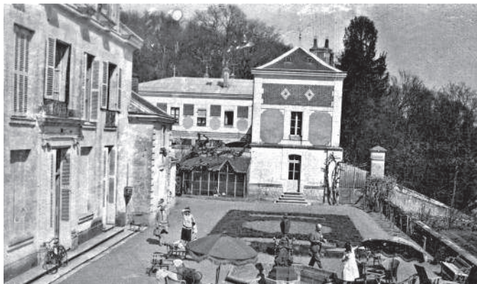
Шато, которое снимала моя бабушка, чтобы сдавать его богатым гостям