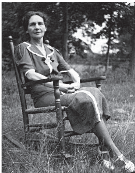
Бабушка незадолго до смерти

Дети, перебираясь из страны в страну, получали лишь поверхностное образование и в конце концов были размещены матерью в школы-интернаты. Моя мама попала в школу при католическом женском монастыре в городе Дамфризе в Шотландии. Завершив там учебу, она вернулась в Париж, где устроилась работать монтажером во французском филиале американской кинокомпании Paramount. Вскоре она встретила моего отца.