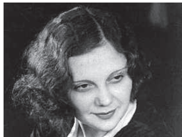
Моя мама еще до знакомства с моим папой. Париж